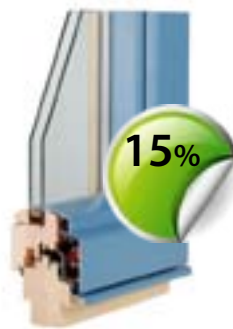
Les - alu okna