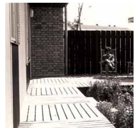
Murgle, kjer je leta 1966 gradila Jelovica.